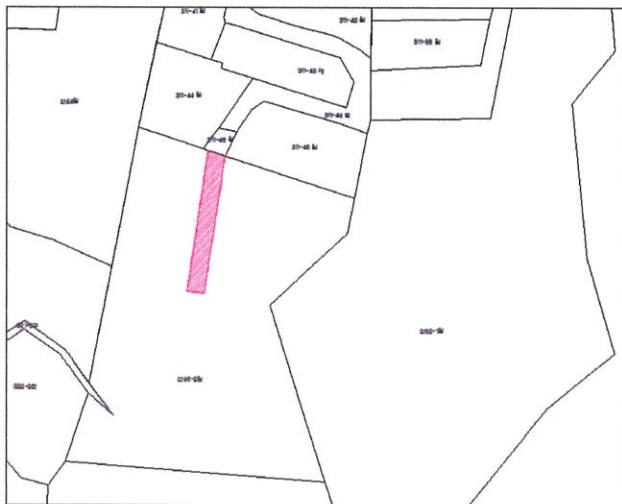
구 적 표