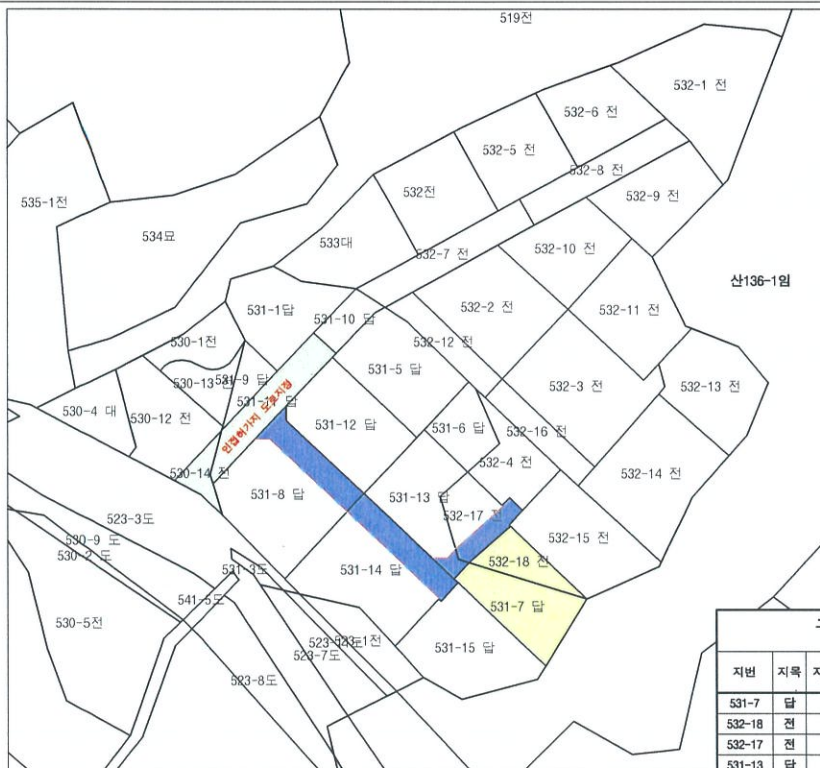
구 적 표 (개발행위허가)