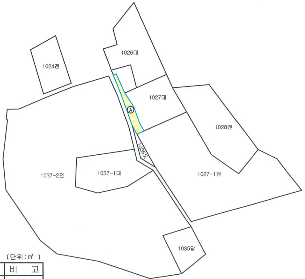
○지번별 도로지정면적 (단위: m 2 )